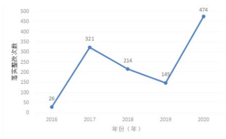
图 2：2016 年-2020 年茂南区工矿商贸隐患整改数

2016 年—2020 年茂南区工矿商贸行业检查工作详情见表 3。2016 年检查工矿商贸企业 82 家（次），下达整改令 14 项，责令整改 26 处，全部整改落实；2017 年检查企业 131 家（次），下达整改令 46 项，责令整改 26 处，全部整改落实；2018 年检查工矿商贸企业 106 家（次），下达整改令 40 项，责令整改 214 处，全部整改落实；2019 年检查工矿商贸企业 85 家（次），下达整改令 33 项，责令整改 145 处，全部整改落实；2020 年检查工矿商贸企业 103 家（次），下达整改令 95 项，责令整改 474 处，全部整改落实。