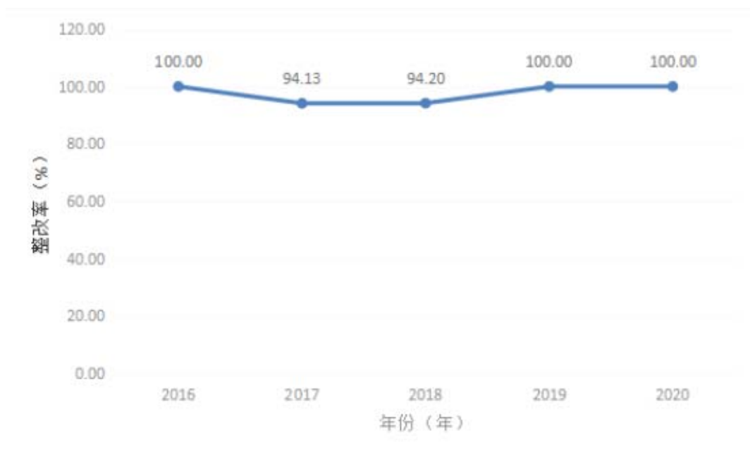
图 1: 2016 年—2020 年茂南区危化品检查工作隐患整改率

2016 年—2020 年危化品隐患整改率平均为 97.67%，其中 2016、2019 和 2020 年整改率均达到 100%，处于较高水平。2016 年—2020 年茂南区危化品检查工作隐患整改率详情见图 1。